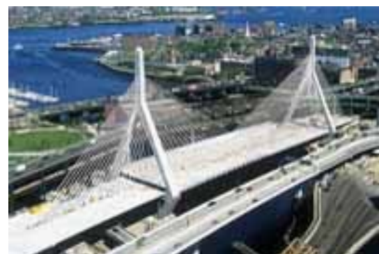
Charles River Brücke

Das Boston CA/T - Projekt - „the big dig“ im Internet: