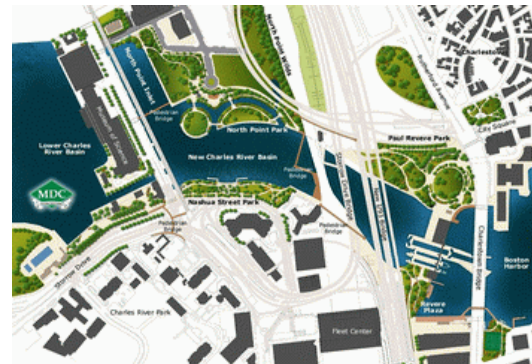
Der neue Charles Park