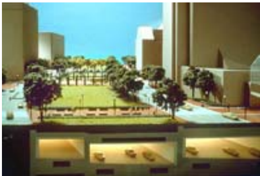
Rose Kennedy Greenway oberhalb des Tunnels

Eine der Brücken über den Charles River wurde 1999 eröffnet und der Tunnel zum Airport im Januar 2003. Das gesamte Projekt sollte bis Ende 2005 fertig gestellt worden sein einschließlich des Rückbaus der vorhandenen Trassen und der Neugestaltung der neu gewonnenen Flächen.