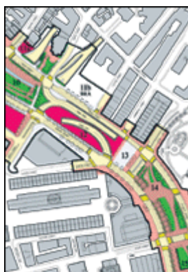
„Paket-lösungen“ der neuen zentralstädtischen Areale